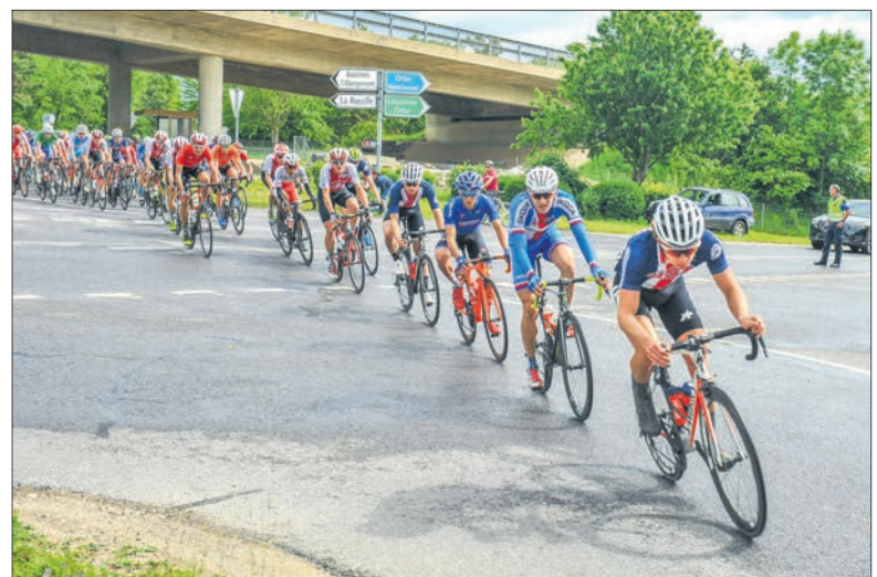
Lors de la dernière étape entre Cossonay et Tartegnin, le peloton a été aperçu aux Clées, peu après 10h, hier.