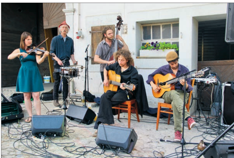
Plusieurs animations ont rendu la fête franchement réussie du côté de Bioley-Magnoux. Ici, l'orchestre Paf le Swing.